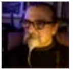
testo di Roby Noris

"Trump sta semplicemente applicando su scala globale una vecchia regola di comportamento: tutto è moralmente lecito, a patto che le azioni condotte aumentino l'utilità generale o particolare. È il principio dell'utilitarismo, una teoria contro cui la Chiesa ha da sempre lottato. È l'esatto contrario della matrice cattolica, che ha favorito l'etica delle virtù e ha generato l'economia civile"